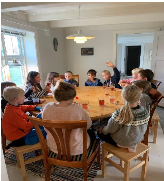
Unger samlet i prestegårdskjøkkenet.