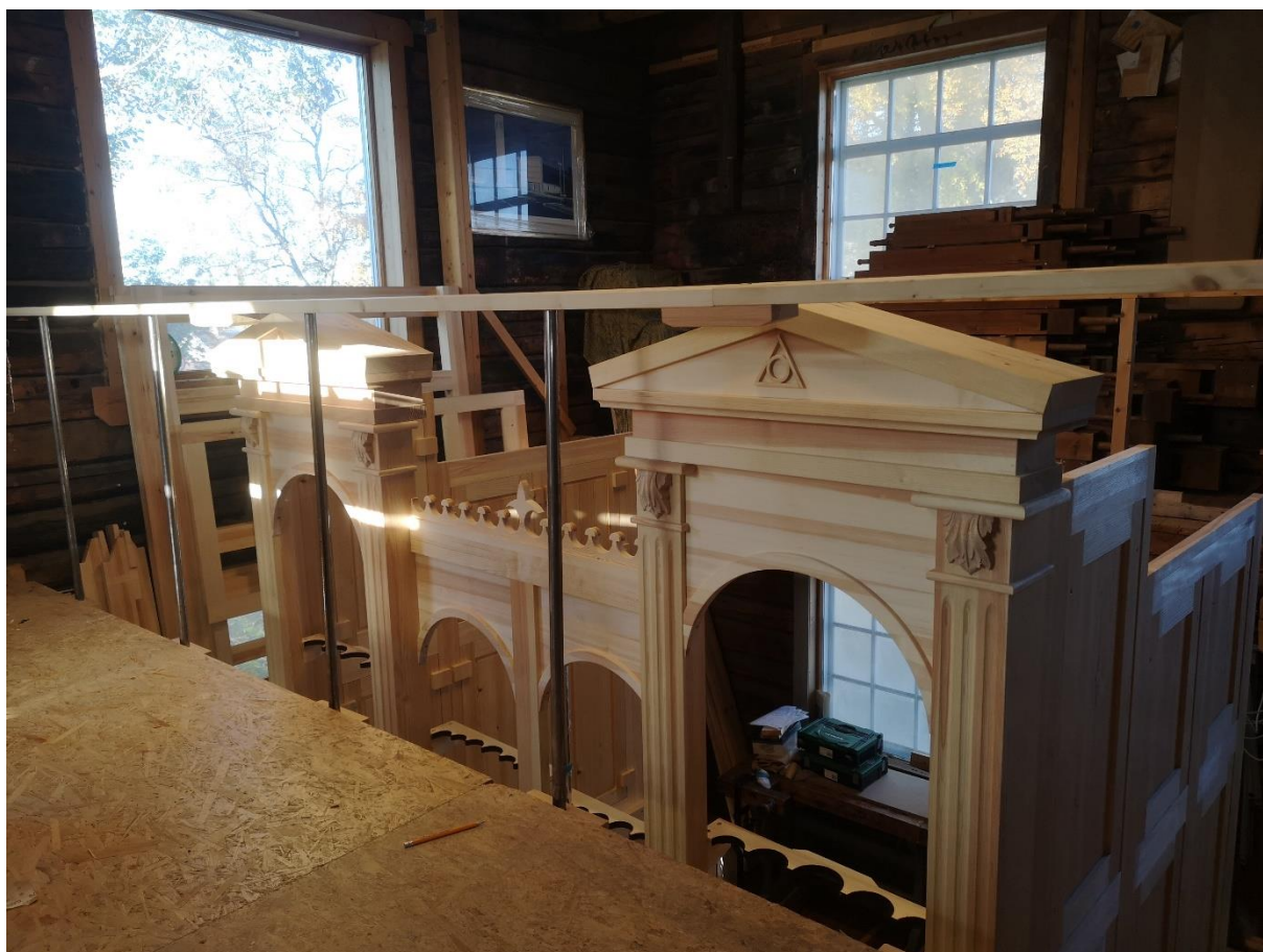
Orgelfasaden blir montert høsten 2019

Lurøy kirkes liturgiske korgruppe: til flere gudstjenester har det vært trommet sammen en liturgisk korgruppe som har sunget bl.a. utvidet Gloria, Litaniet og Taizé salmer. En stor takk til alle som har beriket høytidsdagene på denne måten!